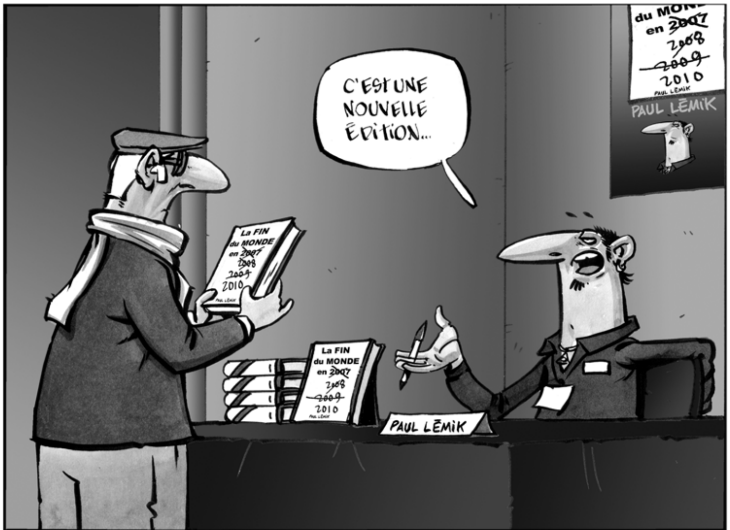
Texte : Alain M. Bergeron Illustration : Sampar

Le droit d'auteur est, avec la liberté d'expression, un des droits fondamentaux des créateurs et fait partie de ce qu'on nomme la propriété intellectuelle. Une loi existe (la Loi sur le droit d'auteur ) au Canada qui donne au seul titulaire d'une œuvre, souvent le créateur, des droits.