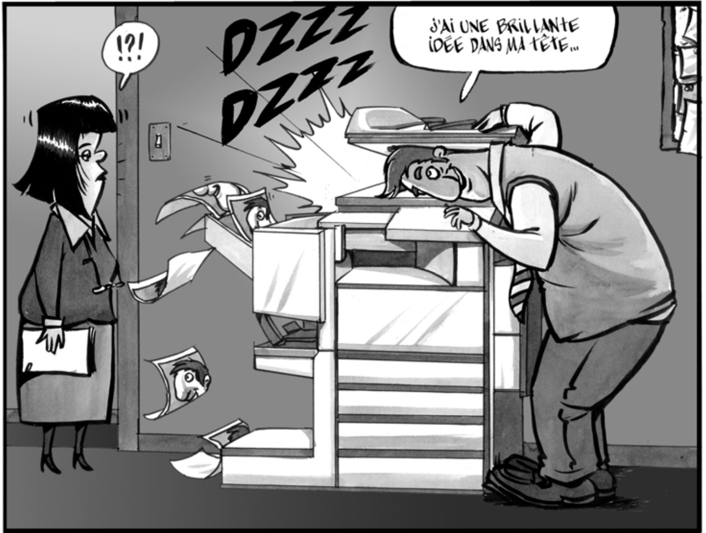
Texte : Alain M. Bergeron Illustration : Sampar

Le droit d'auteur, c'est avant tout le droit exclusif de reproduire une œuvre originale.