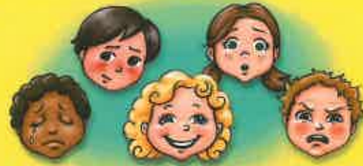
Apprendre à gérer mes émotions