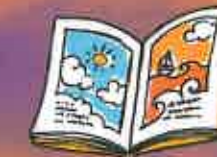
regarder un livre