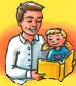
Me faire lire des histoires