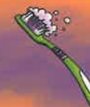
brosser ses dents