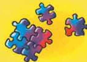
Faire des casse-tête