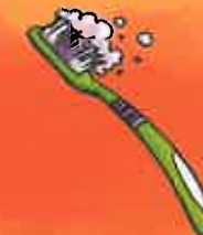
brosser ses dents