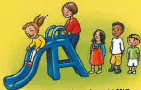
Attendre mon tour