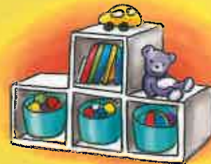
Apprendre à ranger