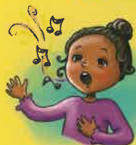
Chanter des chansons