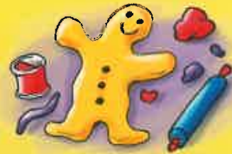
Jouer avec de la pâte à modeler