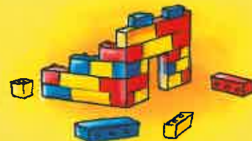
Jouer avec des blocs