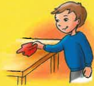
Avoir de petites responsabilités