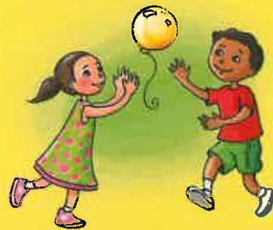
Jouer avec des amis