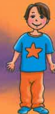
mettre son pyjama