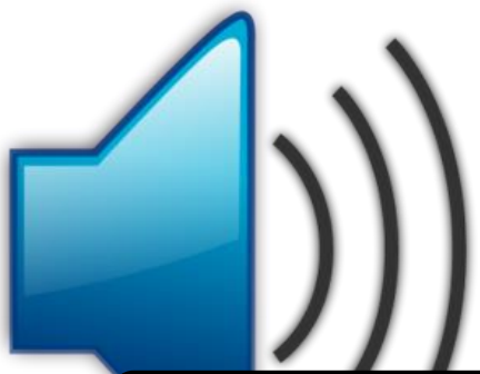
technicien du son